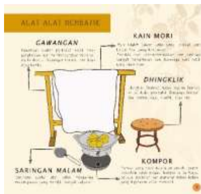
Gambar 1.2 Isi Halaman Buku Batik Bogor