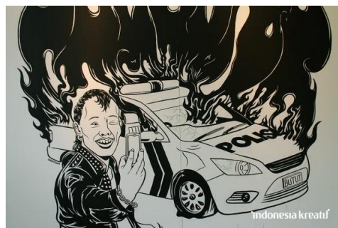
Gambar 3. Untitled