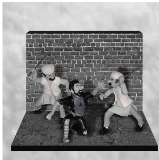
Gambar 1. Front Pembela Tintin.