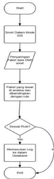
Gambar 3.1 Flowchart Desain Utama

Sistem yang dibangun adalah Intrusion Prevention System Berbasis sebuah system yang menggunakan software open source yaitu Snort. Semua paket-paket yang melewati jaringan akan disaring dengan rule-rule yang ada pada Snort sehingga ketika sebuah penyerangan terjadi dan tersaring oleh rule, paket tersebut akan di drop menggunakan firewall dan rule tersebut tersimpan didalam log database.