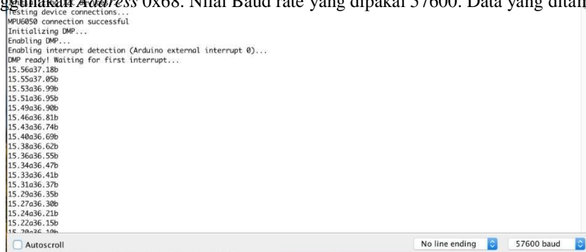
Gambar 4 Hasil sudut dengan sensor MPU6050

Untuk mengetahui hasil pembacaan sudut, kecepatan sudut, dan percepatan sudut berdasarkan waktu. Berikut hasil pembacaan sensor secara I2C, terlihat dari gambar bahwa I2C berhasil terhubung antara sensor MPU6050 dengan mikrokontroler ATmega328P. Alamat pin yang digunakan adalah pin 4 (serial data) dan pin 5 (serial clock). MPU6050 secara default menggunakan Address 0x68. Nilai Baud rate yang dipakai 57600. Data yang ditampilkan keluaran raw dijadikan sudut.