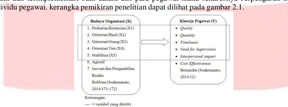
Gambar 2.1 Kerangka Pemikiran

Ditinjau dari teori-teori atau pun hasil dari penelitian terdahulu yang telah dikemukakan di atas, maka dapat diartikan bahwa peranan budaya organisasi/ perusahaan sangat berpengaruh terhadap peningkatan maupun penurunan kinerja individu maupun organisasi. Jika budaya organisasi dalam suatu perusahaan terbukti dalam kategori kuat dan terimplementasi baik dalam diri para pegawai maka seharusnya berpengaruh linier terhadap kinerja individu pegawai. kerangka pemikiran penelitian dapat dilihat pada gambar 2.1.