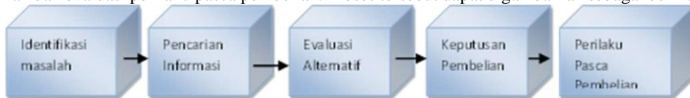
Gambar 1. Tahap Pengambilan Keputusan Sumber: Kotler dan Armstrong (2012:416)

Menurut Kotler dan Armstrong (2012:416) Proses pengambilan keputusan konsumen meliputi serangkaian kegiatan mulai dari identifikasi kebutuhan / masalah, pencarian informasi, evaluasi alternatif, keputusan pembelian dan evaluasi perilaku pasca pembelian. Proses tersebut dapat digambarkan sebagai berikut: