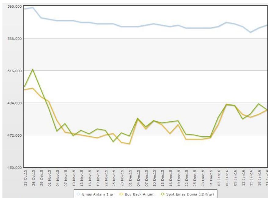
Gambar 1 Pergerakan Harga Emas di Indonesia oktober 2015 – januari 2016