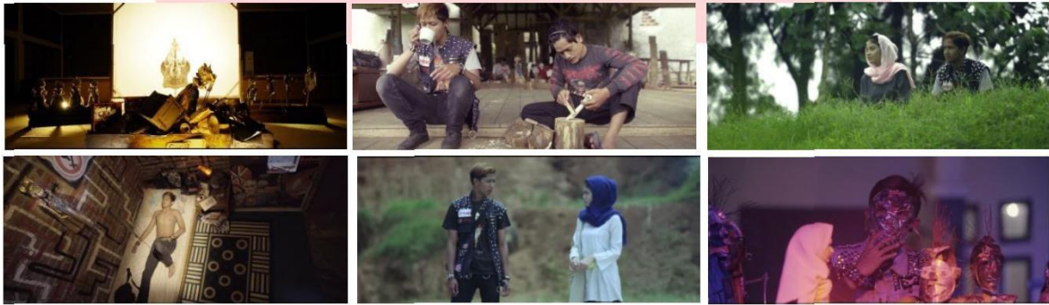
Gambar 4.7.3 Screen Shoot Film.