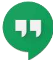
Gambar 1.3 Logo Hangouts

Hangouts adalah aplikasi instant messaging resmi dari Google yang bertujuan untuk memfasilitasi komunikasi di antara dua pengguna secara langsung. Dengan aplikasi ini pengguna dapat mengekspresikan diri dengan aksesoris visual , seperti gambar dan emotikon (hangouts.id.uptodown.com, 2016).