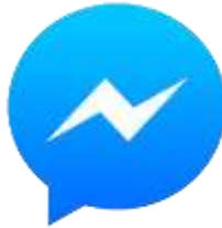
Gambar 1.2 Logo Facebook Messenger

voice note , grup, dan stiker secara real time . Aplikasi Facebook Messenger ini terpisah dari aplikasi Facebook (Setyobudi, 2013).