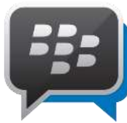
Gambar 1.1 Logo BBM

Blackberry Messenger (BBM) adalah sebuah aplikasi instant messaging yang memungkinkan penggunanya untuk saling berbagi informasi seperti teks, gambar, dan video. Aplikasi ini merupakan aplikasi yang dikeluarkan oleh BlackBerry. Pengguna aplikasi ini dapat menambahkan foto profil atau status. Aplikasi ini juga memiliki fitur grup, dimana pengiriman satu konten dari satu anggota dapat diterima oleh anggota-anggota lain dari grup tersebut (hukumonline.com, 2013).