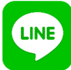
Gambar 1.4 Logo LINE

Juni 2011 oleh NHN cabang Jepang. LINE awalnya didesain untuk Android dan iOS, kemudian berekspansi ke Windows Phone dan komputer desktop. (bersosial.com, 2013)