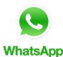
Gambar 1.5 Logo WA

WhatsApp Messenger (WA) merupakan aplikasi instant messaging dimana penggunanya dapat mengirim pesan teks, pesan suara, gambar pada pengguna yang lainnya (whatsapp-messenger.id.uptodown.com, 2016). WhatsApp Messenger (WA) tersedia untuk iPhone, BlackBerry, Windows Phone, Android, dan Nokia. Aplikasi WA ini merupakan aplikasi instant messaging yang dibuat oleh WhatsApp Inc, perusahaan teknologi yang didirikan di Silicon Valley (whatsapp.com, 2016).