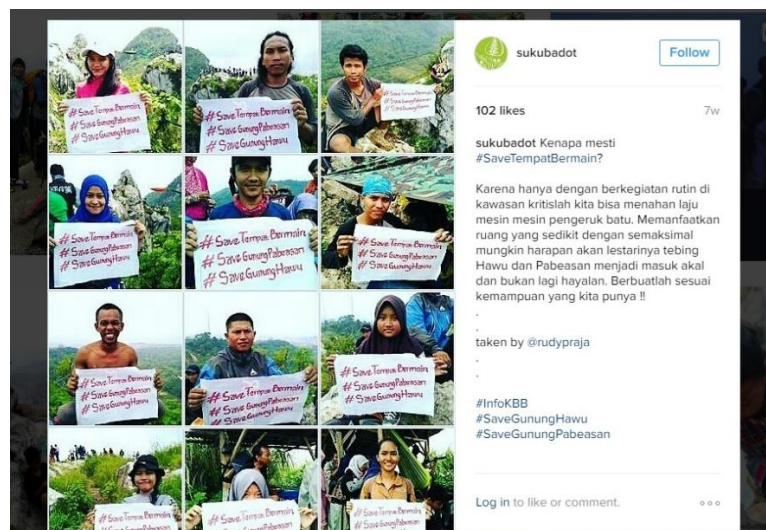
Gambar 1.2 Suku Badot mengajak followersnya untuk melestarikan Gunung Hawu

Suku Badot menggunakan instagram untuk menyuarakan keresahannya kepada masyarakat mengenai Gunung Hawu yang terus-menerus ditambang oleh para penambang ilegal. Suku Badot merupakan suatu bentuk gagasan konservasi dan kampanye untuk kawasan krisis. Melalui instagram, Suku Badot pun mendokumentasikan seluruh kegiatan dan tulisan yang dilakukan dan ditulis oleh Suku Badot agar banyak orang yang ingin bergabung dengan Suku Badot untuk melestarikan dan menjaga Gunung Hawu dari para penambang ilegal.