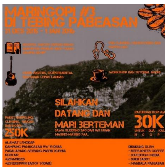
Gambar 1.1 Kegiatan Maringopi #3 oleh Suku Badot

dari Komunitas Suku Badot adalah melindungi sumber daya alam lokal agar tetap lestari. Ada banyak kegiatan menarik yang dilakukan oleh komunitas tersebut, di antaranya fun climbing , hammocking , susur gua dan mata air, botram atau makan bersama di kawasan tebing. Selain itu, yang membuat komunitas Suku Badot menjadi unik adalah kegiatan mereka yang diberi nama “Ngamumule Kaulinan Baheula” yang artinya “Melestarikan Permainan Zaman Dahulu”. Di dalamnya, mereka mengadakan berbagai acara untuk melestarikan permainan tradisional, seperti Festival Langlayangan atau Festival Layangan dan Workshop Egrang. Kemudian mereka pun mengadakan kegiatan dengan nama Maringopi untuk yang ketiga kalinya di Tebing Pabeasan pada tanggal 31 Desember 2015 sampai 1 Januari 2016.