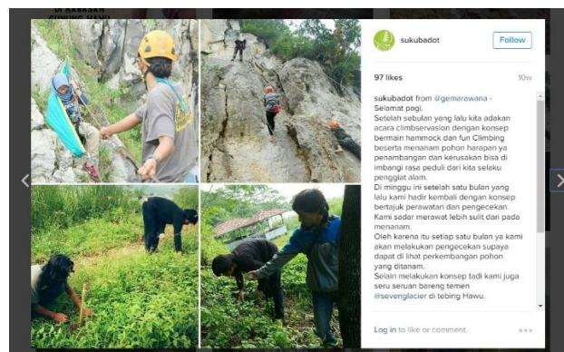
Gambar 1.4 Kegiatan Suku Badot

yang ingin berkontribusi langsung dengan komunitas Suku Badot pun dapat mengetahui informasinya, aspek afektif yang dapat dilihat dari followers yang mengirim comment di instagram @sukubadot dengan kata-kata yang mendukung komunitas Suku Badot serta menanyakan tentang kegiatan-kegiatan Suku Badot dan konatif yang dapat dilihat dari banyaknya orang-orang dan komunitas yang telah menjadi followers instagram @sukubadot untuk berkontribusi secara langsung dengan kegiatan-kegiatannya. Alasan penulis memilih sikap dalam penelitian ini karena melihat dari banyaknya followers yang ikut bergabung dengan kegiatan Komunitas Suku Badot dan banyak juga yang memberi dukungan kepada Komunitas Suku Badot. Dan followers yang dimaksud dalam penelitian ini adalah yang sudah pernah ikut bergabung dengan kegiatan-kegiatan yang diadakan oleh Komunitas Suku Badot.