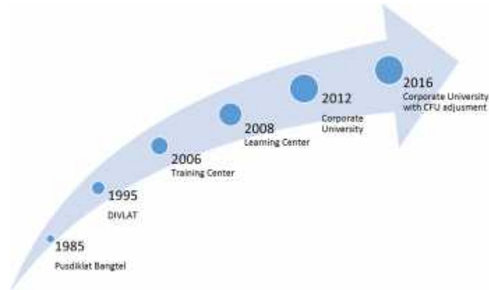
Gambar 1.1 Perkembangan Pusdiklat Telkom Menjadi Telkom CorpU