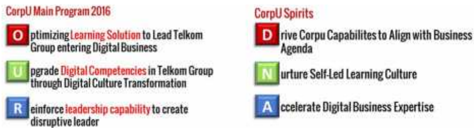
Gambar 1.2 Program Utama Telkom CorpU

Telkom CorpU Center dalam rangka mengembangkan World-class people and culture , menetapkan program utama dan spirit “Disruptive Learning” 2016 sebagai berikut :