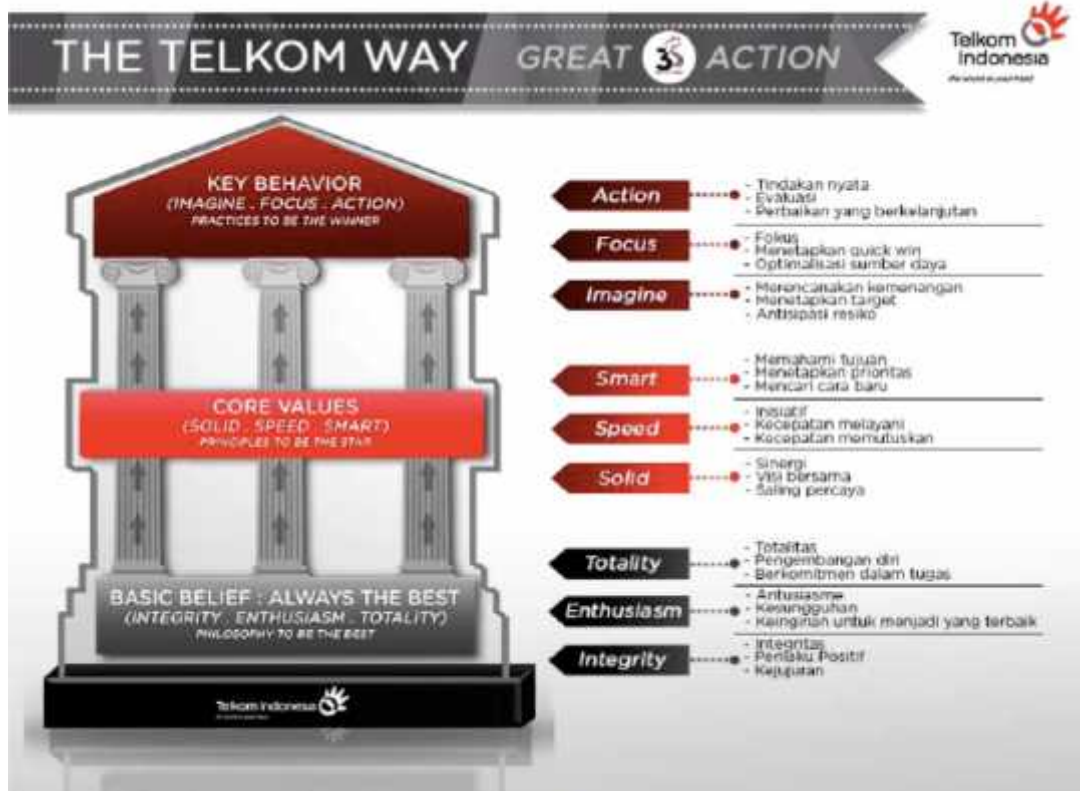
Gambar 1.4 Budaya Telkom CorpU