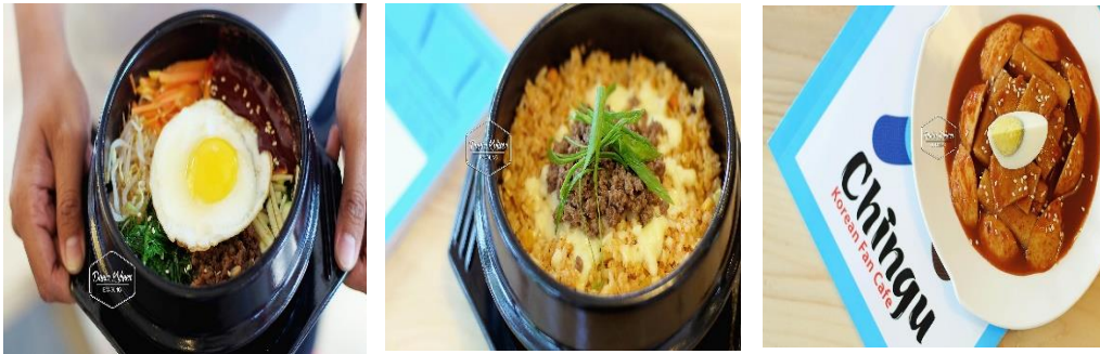
Gambar 1.3 Menu Chingu Cafe