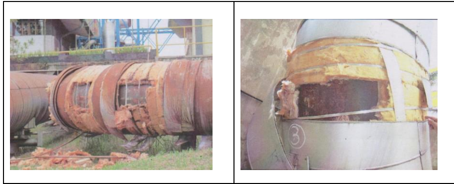
Gambar I.3 Korosi Pada Pipa Alir Uap Utama Unit 1

Risk Based Inspection (RBI) merupakan sebuah pendekatan penilaian risiko dan manajemen proses yang terfokus pada kegagalan peralatan karena kerusakan material (API 581, 2000). RBI adalah suatu metode untuk menentukan rencana inspeksi (peralatan mana dan kapan harus diinspeksi) berdasarkan risiko kegagalannya. Berbeda dengan metode time based inspection dimana inspeksi telah dijadwalkan berdasarkan waktu yang umumnya dilakukan setiap beberapa tahun sekali yang biasanya didapat dari manual book suatu peralatan, RBI memprioritaskan inspeksi peralatan berdasarkan risikonya dimana peralatan dengan risiko tinggi yang lebih diprioritaskan. RBI membatasi peralatan yang masuk dalam jangkauannya yaitu peralatan-peralatan bertekanan dan stasioner. Dengan metode RBI dapat diperoleh keluaran seperti pemeringkatan risiko peralatan, penentuan akhir umur peralatan dan juga program interval inspeksi peralatan yang lebih terarah.