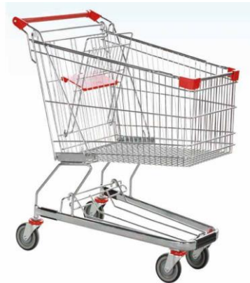
Gambar I.2 Troli Supermarket

Dengan banyaknya macam barang yang dapat dibeli di supermarket maka pihak supermarket biasanya menyediakan sebuah produk yang dapat membawa barang ketika pelanggan berada di supermarket seperti troli. Berikut gambar troli yang biasa digunakan oleh pelanggan ketika membawa barang belanjaan ketika berada di supermarket.