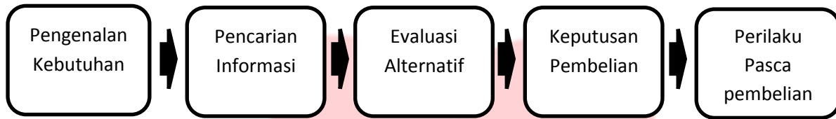
Gambar 2 Proses Keputusan Pembelian

Menurut Kotler dan Amstrong (2012:176), tahapan dalam proses pengambilan keputusan pembelian terdiri dari lima tahap, yaitu: