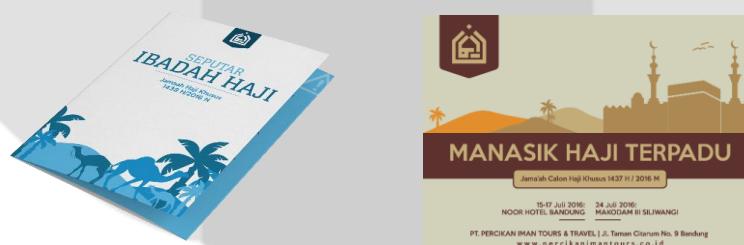
Gambar 2: Media Pendukung

Mengambil judul “Panduan Menunaikan Ibadah Haji”, buku ini berisi pesan utama tentang panduan-panduan ibadah haji yang telah dikemas dengan baik sesuai dengan tuntunan haji yang sama seperti Rasulullah ﷺ lakukan. Sehingga media buku ini mampu memberikan materi panduan ibadah haji secara jelas dan mudah bagi calon jamaah haji serta mampu menjadi buku pembelajaran tentang pelaksanaan ibadah haji.