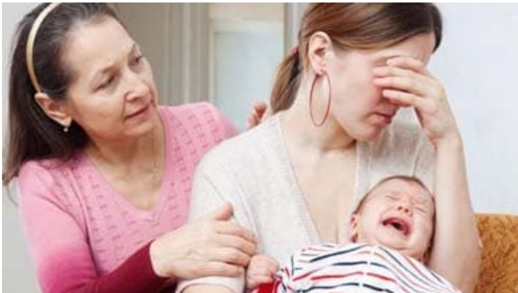
Gambar 2. 1 Contoh Ibu Yang Mengalami Baby blues syndrome

Depresi ini termasuk dalam kategori depresi tingkat rendah sehingga sering tidak teridentifikasi yang menjadi salah satu faktor gejala depresi ini terabaikan. Padahal apabila sang ibu tidak mengetahui atau mengabaikan baby blues syndrome ini dan tidak dapat melewatinya dengan baik akan berdampak pada tingkat depresi lebih lanjut, yaitu depresi postpartum atau yang lebih parah psikosis postpartum .