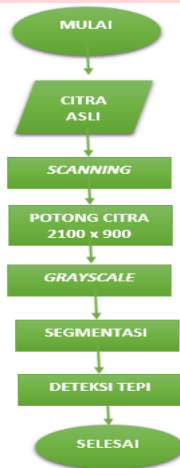
Gambar 3.2 Diagram Alir Proses Preprocessing

Tahap pertama yang dilakukan adalah pengambilan citra. Pengambilan citra dilakukan dengan scanning dari citra ronsen panoramic, lalu di seragamkan dengan di potong ke piksel 2100x900 dan mengubah ke dalam format JPG, lalu dikonversikan ke grayscale untuk menyederhanakan dan mempercepat waktu komputasi, lalu dilakukan proses segmentasi dengan mengambil bagian ciri citra yaitu gigi second dan third molar bagian kanan dan kiri.