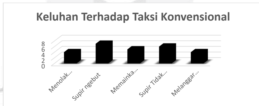
Gambar 1.1 Diagram Keluhan Terhadap Taksi Konvensional

Walaupun demikian, keluhan dari pihak konsumen tetap ada misalnya konsumen merasa kurang puas dengan pelayanan yang diberikan dalam arti tidak sesuai antara harapan dengan tuntutan. Tuntutan ini biasanya meliputi keamanan, kenyamanan, keselamatan yang diberikan jasa transportasi taksi. Berikut terdapat keluhan pelanggan taksi konvensional yang terlampir dilampiran 1 berupa ungkapkan di media sosial seperti twitter dan facebook berupa supir tidak mau mengangkut penumpang dan juga wawancara seperti supir ngebut, supir tidak ramah, memainkan argo, dan melanggar lalu lintas. dan telah di dapat data untuk mengetahui keluhan pelanggan terhadap taksi konvensional sebagai berikut :