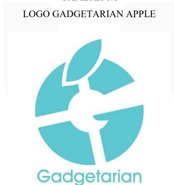
GAMBAR 1.1 LOGO GADGETARIAN APPLE