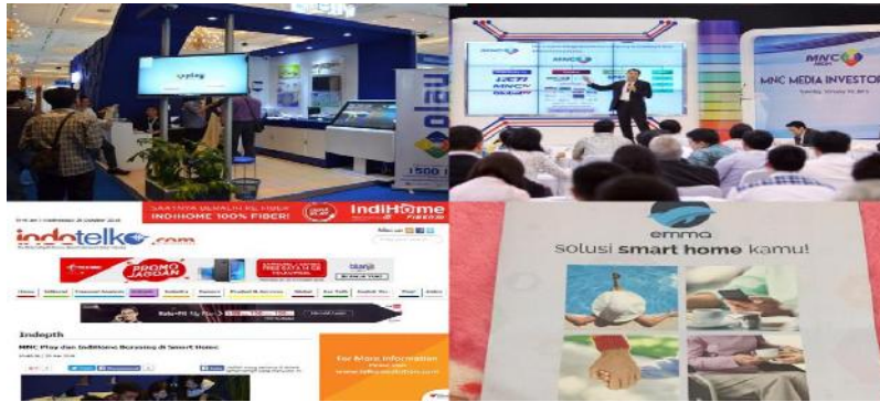
Gambar I. 3 Beberapa bentuk promosi produk smarthome