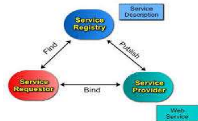
Gambar 2.1 Arsitektur Web Service

Secara umum, arsitektur web service dapat dilihat pada gambar 2.1