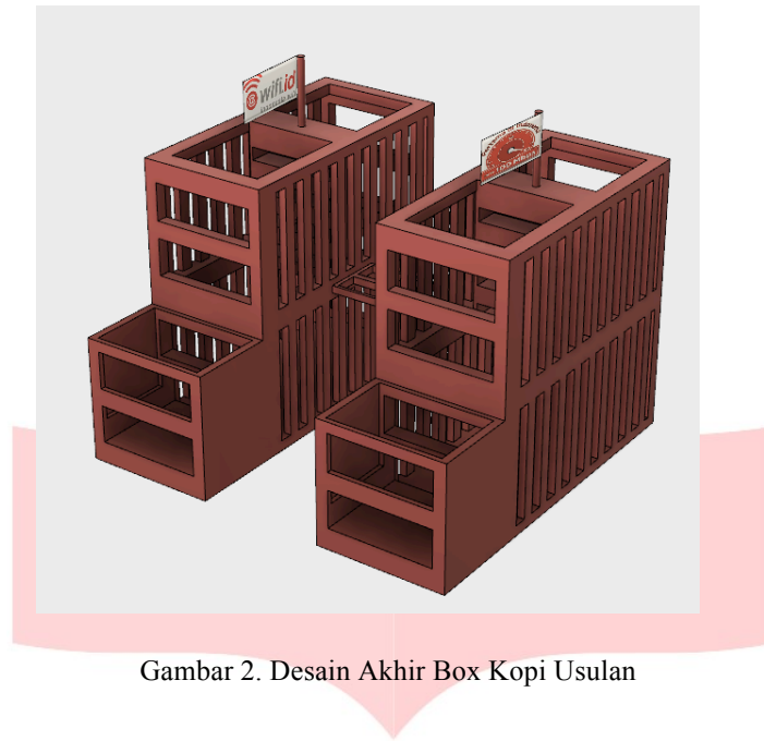
Gambar 2. Desain Akhir Box Kopi Usulan