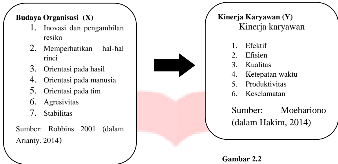
Gambar 2.2 Kerangka Pemikiran