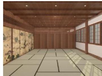
Gambar 3.10 Visualisasi ruang kebudayaan area tatami