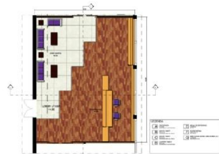
Gambar 3.6 Layout area Lobby utama

Pada layout The Japan Foundation yang telah dirancang, terdapat satu lobby utama yang berada diantara area kantor dan galeri. Pada bagian ini terdapat beberapa area, yaitu area resepsionis, area santai, dan area logo The Japan Foundation , Jakarta, sebagai tanda identitas area gedung yang digunakan.