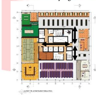
Gambar 3.5 ilustrasi sirkulasi linear lantai 3

Sistem sirkulasi yang digunakan adalah sirkulasi linear, dimana pengunjung yang masuk dan keluar di area yang sama.