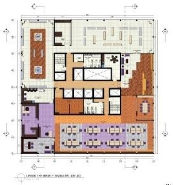
Gambar 3.1 layout lantai 2