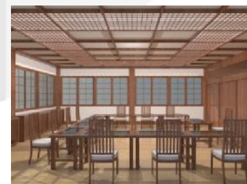
Gambar 3.11. Visualisasi ruang kebudayaan area duduk