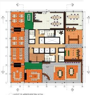
Gambar 3.3 layout lantai 4