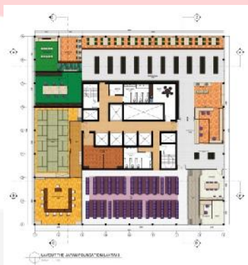
Gambar 3.2 layout lantai 3