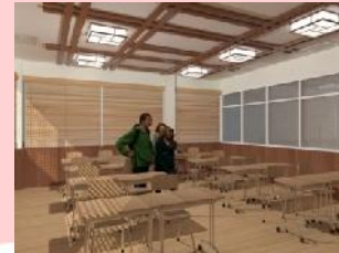
Gambar 3.14 Ruang kelas tipe tradisional