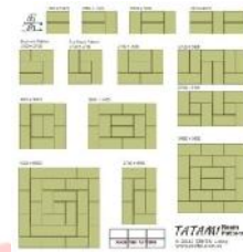
Gambar 3.4 pola tatami

Konsep “ Traditional of Japan ” yang diambil mengambil bentukan ruang dengan pola grid dari tatami, sehingga ruang-ruang dalam The Japan Foundation diharapkan dapat saling berhubungan dan berkesinambungan.