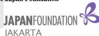
Gambar 2 logo The Japan Foundation Jakarta

The Japan Foundation merupakan organisasi nirlaba semi pemerintahan yang didirikan pada bulan Oktober 1972 di Kansai, Jepang. The Japan