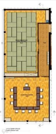
Gambar 3.9 Layout Ruang Kebudayaan

Pada area lantai tiga, denah khusus yang diambil adalah ruang kebudayaan yang memiliki dua area, yaitu area tatami dan area duduk dengan fasilitas yang sama dengan kelas bahasa. Area ini menggunakan tema ruang minum teh, sebagai representasi kegiatan kebudayaan yang paling sering dilaksanakan, yaitu upacara minum teh.