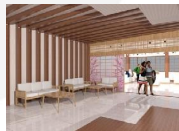
Gambar 3.7 Visualisasi area tunggu

Pada area ini memberikan kesan pertama pada pengunjung tentang identitas The Japan Foundation , serta sebagai jembatan pengunjung untuk mengunjungi fasilitas lainnya. Pada area resepsionis, pengunjung dapat diarahkan menuju galeri yang berada di sebelah lobby utama, dan bagi pengunjung yang berkepentingan dengan petugas kantor dapat langsung dilayani.