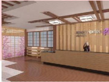
Gambar 3.8 Visualisasi area resepsionis