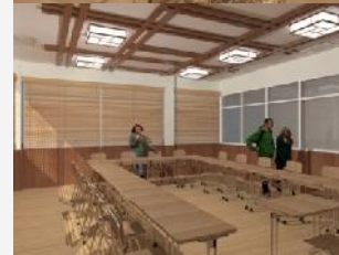
Gambar 3.15 Ruang kelas tipe U