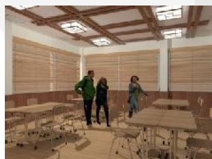
Gambar 3.13. Ruang kelas tipe group