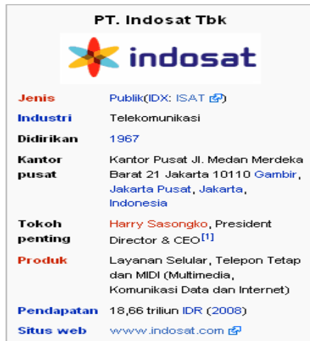
GAMBAR 1.1 PROFIL PT. INDOSAT, Tbk