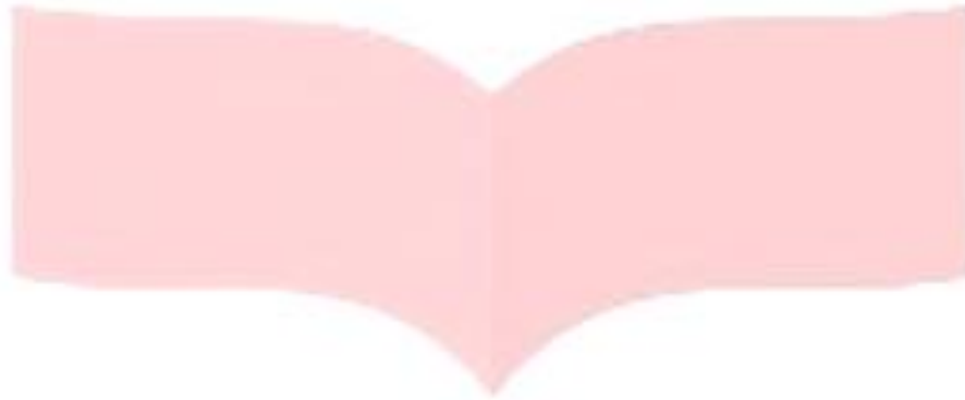
Gambar 4.4 Analisis Perbandingan Pengukuran dan Simulasi