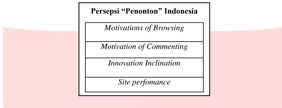
Gambar 2.3 Model Kerangka Pemikiran