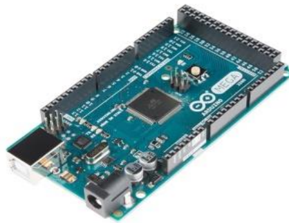
Gambar 2.2 Arduino