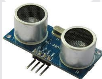
Gambar 2.5 HC-SR04

Pada sensor HC-SR04 memiliki tekstur kecil sehingga sangat mudah untuk disembunyikan dan dapat disimpan di bagian depan pada slot parkir yang digunakan sehingga ketika kendaraan parkir sensor masih dapat mendeteksi keberadaan kendaraan didepannya.