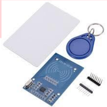
Gambar 2.4 MFRC522

Data yang diterima reader RFID merupakan data yang diperoleh dari proses pen-transmisi data dari tag . Data tersebut merupakan suatu susunan nomor unik yang berisi informasi identifikasi yang dapat digunakan untuk smart card , pencarian lokasi, maupun informasi spesifik yang terdapat pada suatu produk yang memiliki tag .