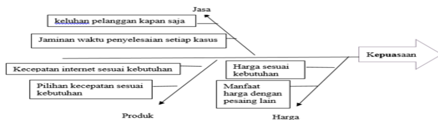
Gambar 4.11 Analisis Fish Bone

1. Pada kualitas jasa skor terendah ada pada Operasional nomor 3. Indihome dapat menerima keluhan pelanggan kapan saja yang berarti Indihome belum memenuhi keluhan pelanggannya tepat waktu atau tidak sesuai dengan keinginan pelanggan.