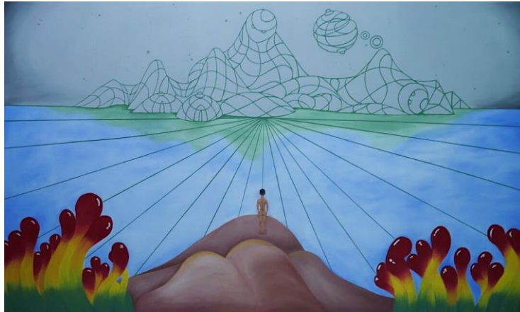
Gambar 3.3 karya 1 (The Regret) acrylic on canvas, 120cm x 200cm.

Dapat dilihat di dalam lukisan tersebut terdapat sosok pemuda yang sedang berdiri di atas gundukan tanah yang menyerupai bentuk pantat dan sedang melihat ke arah gunung yang menyerupai bentuk 2 orang yang sedang berpose lemas setelah bersenggama. Seperti salah satu pandangan filsuf Aristoteles, ia mengatakan bahwa seni merupakan sebuah tiruan (mimesis) dari kenyataan atau alam. Di lukisan tersebut juga penulis menampilkan 2 perspektif yang berbeda, mulai dari yang nyata di bagian sosok pemuda hingga laut dan bagian gunung hingga langit yang memakai warna abu-abu yang merepresentasikan ketidakjelasan atau kelim.