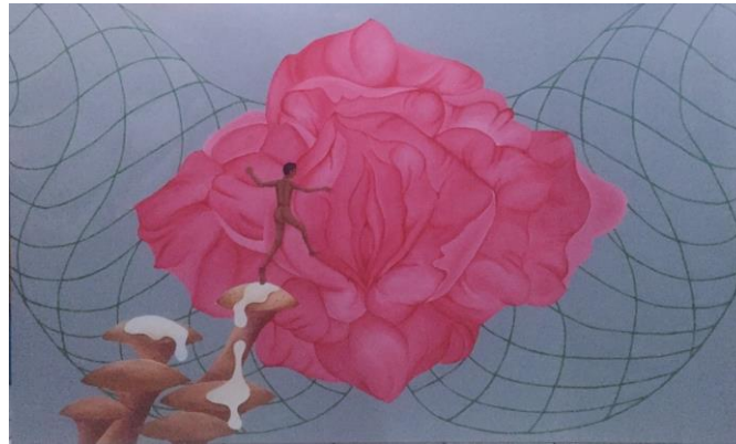
Gambar 3.13 karya 3 (Obstructed By Reality), acrylic on canvas, 120cm x 200cm.

Jika dilihat secara singkat kita akan melihat sebuah bunga berwarna merah muda yang begitu besar terletak di tengah-tengah lukisan, namun jika kita lihat dengan seksama penulis memberikan sedikit perubahan terhadap bunga tersebut yaitu tepat di bagian mahkota bunga yang digantinya dengan bentuk kelamin wanita, dan garis lengkung atau curves yang membentuk paha, yang jika dilihat secara keseluruhan kita akan melihat seorang wanita yang sedang membuka kakinya dengan lebar.