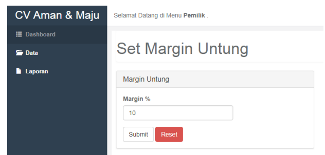
Gambar 3 Halaman Set Margin

Berikut merupakan tampilan dari fungsionalitas set margin yang hanya dapat di akses oleh bagian pemilik. Pada halaman ini pemilik dapat set margin untuk menentukan harga jual.