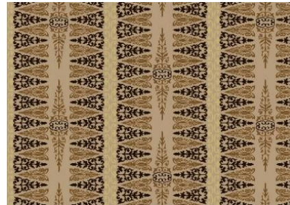
Gambar 5 Motif 3 Single Motif dan Repetisi

Jenis repetisi: Half Drop (column offset) (yaitu jenis repetisi atau pengulangan yang digeser atau diturunkan kurang dari setengahnya. Pengulangan dilakukan secara vertikal).