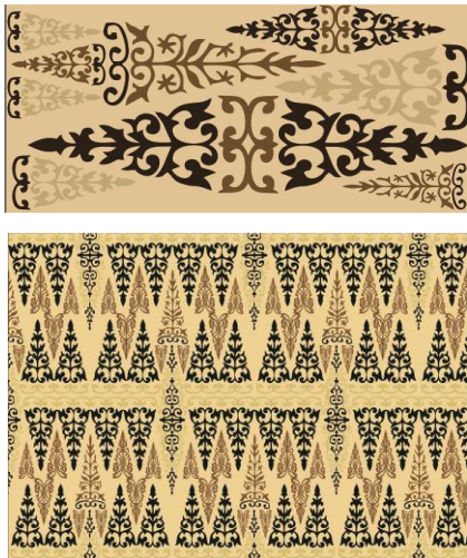
Gambar 7 Motif 5 Single Motif dan Repitisi

Jenis repitisi: Brick (row offset) (yaitu jenis repitisi atau pengulangan yang digeser atau diturunkan kurang dari