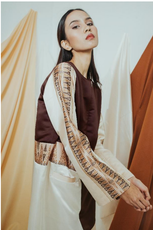
Gambar 11 Visualisasi Produk 3