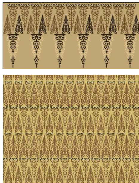
Gambar 3 Motif 1 Single Motif dan Repitisi

Jenis repitisi: Square Repeat (yaitu jenis repitisi / pengulangan yang paling sederhana. Motif dibentuk secara penuh dan konsisten sehingga membentuk sebuah grid ).