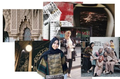
Gambar 2 Lifestyle Board

Dalam imageboard , penulis ingin menunjukkan sifat tradisional dari kebudayaan Melayu Riau dengan dipadukan nuansa modern dari potongan busana modest wear . Serta perpaduan antara ruang kosong dan detail motif yang sedikit rumit. Selain itu juga, penulis ingin memadukan karakter keras dan lembut menjadi sebuah kesatuan yang harmonis. Nuansa warna yang diangkat adalah earthy , yang terdiri atas broken white , peach , kuning hingga coklat kehitaman.