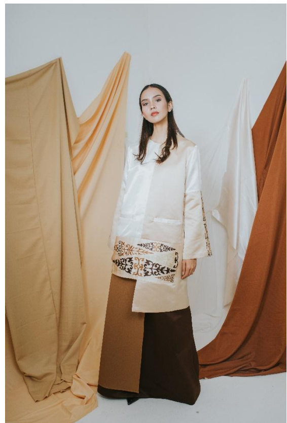
Gambar 13 Visualisasi Produk 5