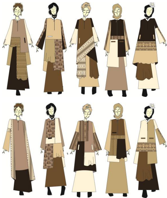
Gambar 8 Sketsa Awal Produk

yang berbeda, menyesuaikan dengan warna dasar dari lembaran print komposisi motif yang digunakan. Hal ini dibuat sebagai sebuah alternatif, karena baju kurung tradisional biasanya hanya menggunakan satu warna yang sama (atasan dan bawahan memakai bahan yang sama).