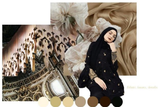
Gambar 1 Imageboard

Berdasarkan beberapa data di atas, penulis menjadikannya sebagai dasar dalam perancangan. Produk yang dibuat berupa koleksi busana modest wear yang terinspirasi dari baju kurung, yaitu dari potongan baju dan roknya yang panjang serta potongan lengan yang panjang dan lebar. Kemudian dilakukan beberapa perubahan bentuk pada lengan dan siluet serta penambahan teknik layering pada busananya. Untuk motifnya, mengangkat kembali ornamen pucuk rebung yang dikomposisikan secara variatif namun tetap menyisipkan komposisi dasar dari pucuk rebung yang asli. Warna yang digunakan adalah nuansa broken white , kuning serta coklat. Maka dari itu, konsep yang diangkat adalah versatility .