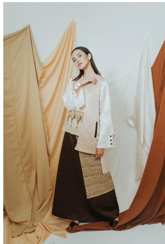
Gambar 9 Visualisasi Produk 1

Dalam koleksi busana modest wear ini terdapat lima buah look yang mana merupakan 5 buah desain sketsa terpilih dilengkapi dengan motifnya. Berikut visualisasi dari kelimanya: