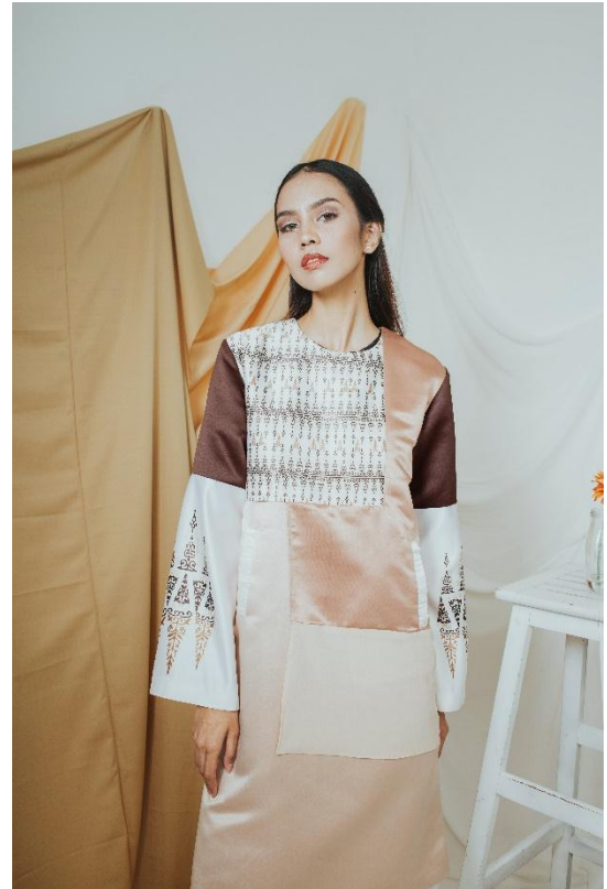
Gambar 12 Visualisasi Produk 4