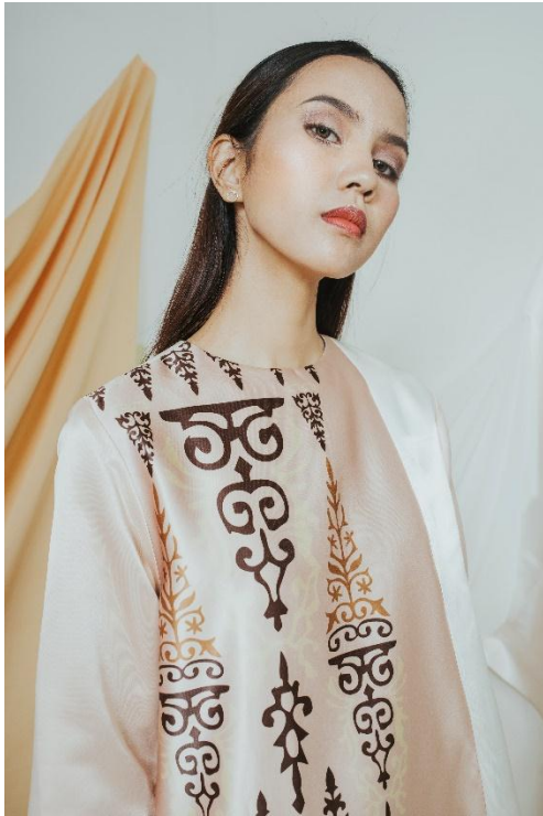
Gambar 10 Visualisasi Produk 2