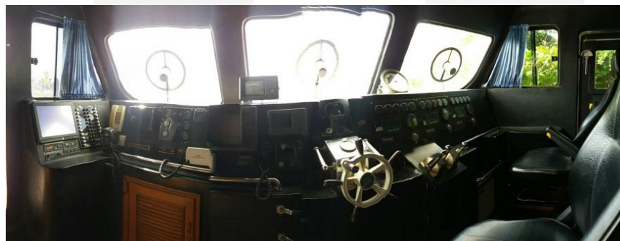
Gambar 2. Ruang Kemudi Kapal Penyelamat BASARNAS