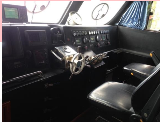
Gambar 1. Area Kemudi Kapal Penyelamat BASARNAS

Pada ruang kemudi dilengkapi dengan roda(steer/jantar) kemudi yang berada di tengah, dashboard, kursi kemudi, kursi komando, meja peta, meja radio, alat-alat komunikasi dan kursi operator yang dapat diatur maju mundur dan naik turun. Menurut COLREG 1972 dan Dinas Jaga Anjungan, menuliskan di Bab V terdapat kewajiban-kewajiban perwira jaga navigasi atau juru kemudi, salah satunya adalah tidak boleh meninggalkan anjungan sebelum diganti atau berjaga. Pada saat berjaga, pengemudi kapal dan nahkoda disarankan untuk duduk dan saat mengemudikan kapal posisi pengemudi seharusnya berdiri.