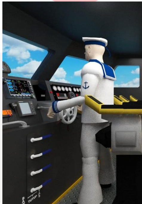
Gambar 6. Saran Postur Tubuh yang sesuai.