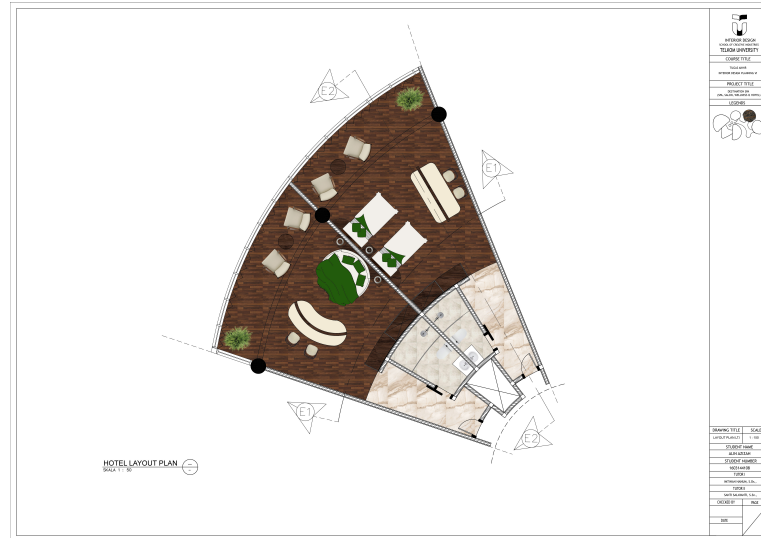
Gambar 4.2 Denah Layout Kamar Hotel