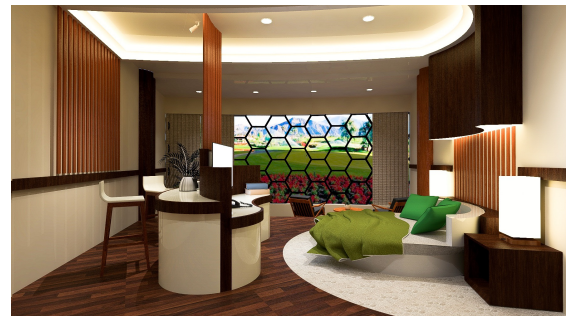
Perspektif Kamar Hotel