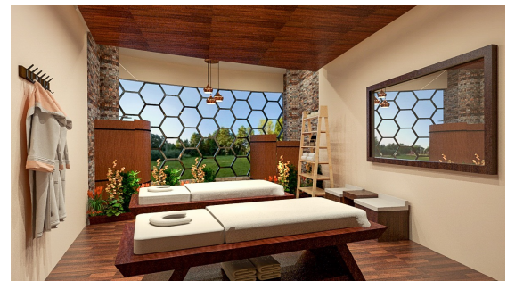
Perspektif Area Salon & Spa