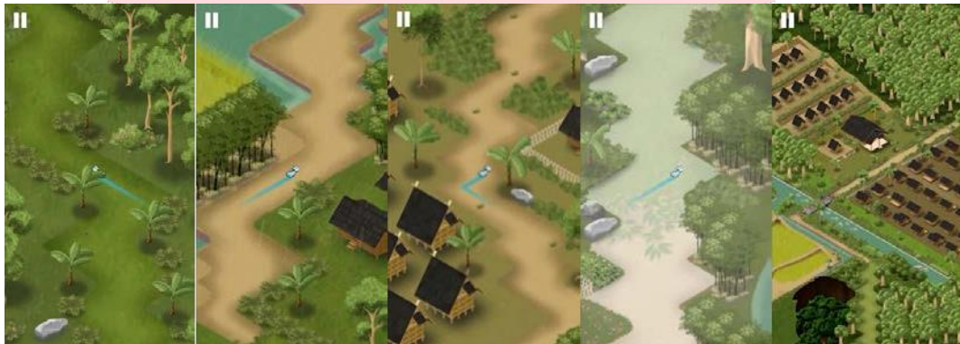
Gambar 5. In-game Preview dari Level 1

Pada game engine , environment artist dan game designer bekerja sama pada penempatan aset-aset visual kedalam game agar sesuai dengan konsep sebelumnya. Pada proses ini, terjadi beberapa perubahan dari sisi penempatan objek seperti leuit, rumah, tanaman semak, serta pohon yang dilakukan agar komposisinya terlihat lebih baik dari konsep yang telah dibuat.