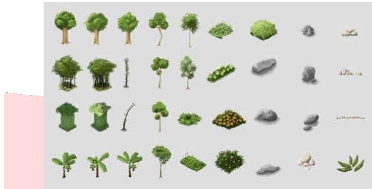
Gambar 1. Aset Flora dan Bebatuan

Dalam perancangan environment bagian flora dan bebatuan, perancang memulai dari membuat sketsa berdasarkan dari referensi foto atau dari data-data hasil observasi yang telah dilakukan. Sketsa yang dibuat kurang lebih sebagai sarana untuk eksplorasi bentuk dari flora dan bebatuan yang akan dibuat. Setelah tahap sketsa, perancang langsung menuangkan sketsa yang dipilih menjadi sebuah aset yang nantinya akan digunakan atau dimasukkan kedalam game engine .