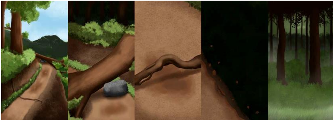
Gambar 8. In-game Cutscene Backgrounds