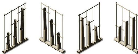
Gambar 6. Angklung Buhun

Aset-aset ini dipakai didalam game sebagai bagian dari environment level lain, background dari cutscene , ataupun sebagai in-game items yang bisa pemain dapatkan ketika bermain game .