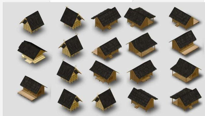
Gambar 2. Aset Bangunan

Sama seperti aset flora, aset bangunan juga dimulai dari sketsa berdasarkan referensi foto atau data hasil observasi yang telah dilakukan. Namun, langkah selanjutnya adalah pengaplikasian sketsa tersebut kedalam bentuk model 3 dimensi guna memudahkan untuk pengambilan bagian-bagian atau sisi lain jika diperlukan, serta render aset bangunan tersebut dalam isometric view .