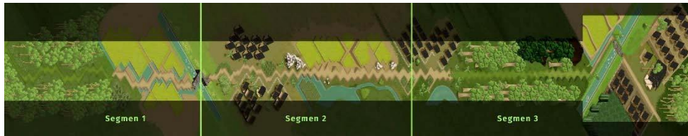
Gambar 4. Konsep Level 1

Sesuai dengan konsep yang diberikan oleh game designer , level 1 memiliki konsep environment sebuah perjalanan yang memperlihatkan suasana sebuah Kampung Sunda. Environment ini terbentuk dari aset-aset visual yang telah dibuat berdasarkan referensi dari hasil observasi dan audio visual.