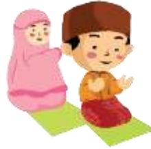
Gambar 4.3 Ilustrasi karakter Annas dan Amnisa (Sumber : Dokumen Pribadi)