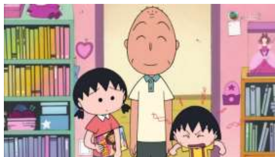
Gambar 4.2 Referensi Ilustrasi Chibi Maruko Chan (Sumber : Dokumen Pribadi)