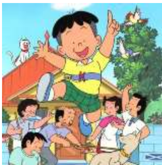
Gambar 4.1 Referensi Ilustrasi Kobo-chan

Keyword yang didapat dari konsep pesan yaitu, karakter islami. Keyword ini memunculkan makna dan membentuk skema visual yang akan digunakan sebagai acuan dalam mendesain visual media. Penggayaan ilustrasi disini menggunakan freehand dengan tidak menggunakan outline. Dengan pewarnaan yang tegas dan lembut. Tokoh pada buku akan memakai peci dan sarung, dan untuk karakter perempuan dibuat berkerudung sebagai simbol umat muslim.