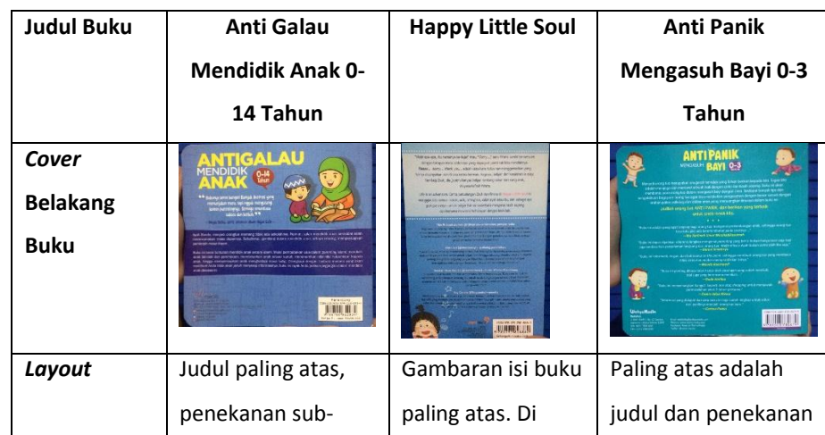
Tabel 3 Analisis matriks sampul belakang buku dari produk sejenis