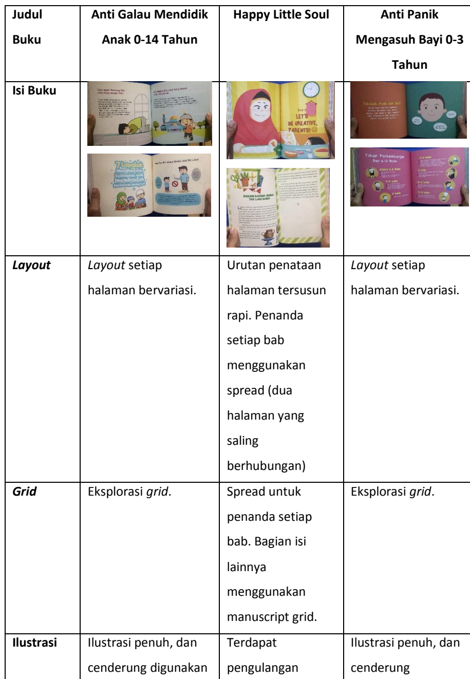
Tabel 2 Analisis matriks isi buku dari produk sejenis