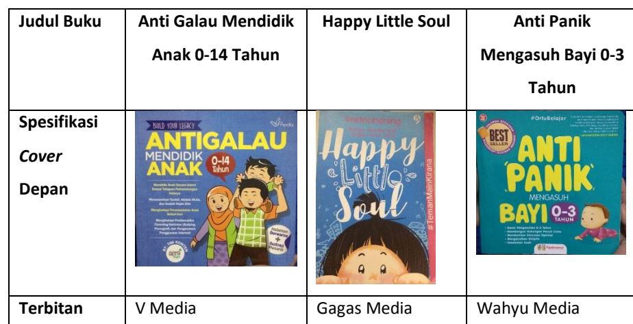
Tabel 1 Analisis matriks sampul depan buku dari produk sejenis