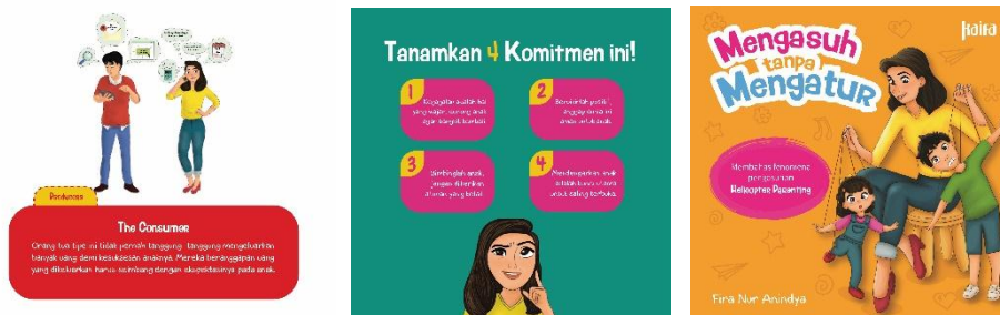
Gambar 6 Hasil Layouting Ilustrasi

Tahap selanjutnya adalah melakukan layouting supaya pengaturannya lebih efisien, penulis menggunakan Adobe Illustrator untuk pengaturan elemen-elemen desain yang telah dirancang.