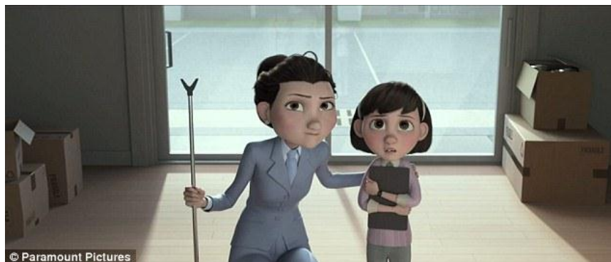
Gambar 2 Referensi Karakter dari Fil Little Prince (2015)

Perancangan karakter didasarkan pada sebuah referensi film animasi berceritakan tentang Helicopter Parenting yang berjudul The Little Prince (2015). Ciri khas tokoh yang terdapat dalam film ini yaitu memiliki mata besar membulat.