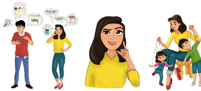
Gambar 5 Hasil Pewarnaan Ilustrasi