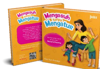
Gambar 7 Hasil Perancangan Akhir Buku Mengasuh tanpa Mengatur

Setelah perancangan selesai, penulis memeriksa kembali kumpulan file yang telah dirancang dan merapikannya, lalu digabung menjadi format pdf yang siap dicetak. Karya pun dicetak dengan teknik jilid lem punggung dan judul buku 'Mengasuh Tanpa Mengatur' pada sampul depan diberikan sentuhan uv varnish.