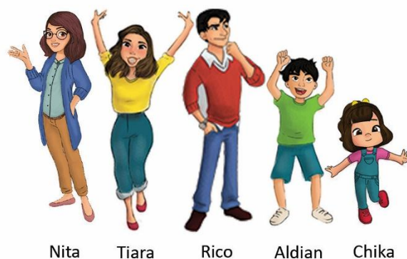
Gambar 3 Hasil Perancangan Karakter

Berdasarkan konsep beserta data yang telah dianalisis, maka terciptalah lima hasil rancangan karakter. Pertama adalah tokoh Nita berusia 27 tahun sebagai tokoh psikolog, lalu ada Bu Tiara 35 tahun sebagai ibu, Rico 37 tahun sebagai ayah, Aldian 10 tahun sebagai kakak, dan Chika lima tahun sebagai adik.