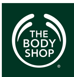
GAMBAR 1.1 Logo Perusahaan

Adapun logo perusahaan ditampilkan pada gambar berikut :