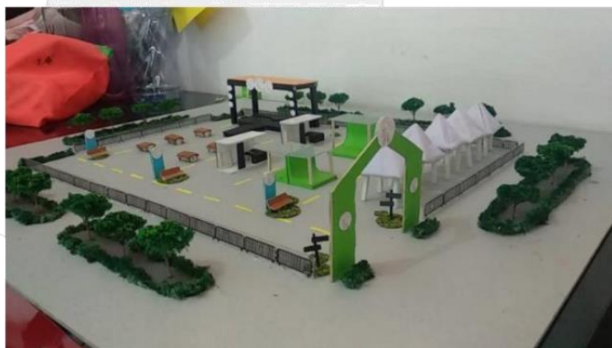
Gambar 4.6 maket festival batik seraci

Festival batik seraci ini akan di adakan dikota Bekasi tepat nya di mall summarecon Bekasi.