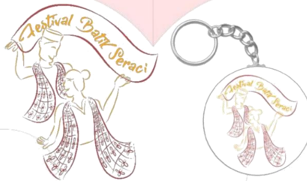
Gambar 4.7 merhandise