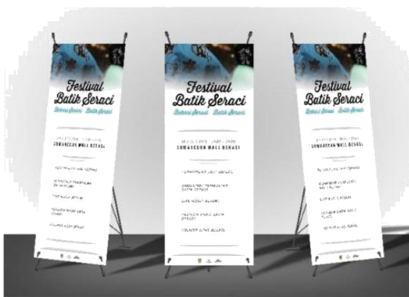
Gambar 4.5 poster utama