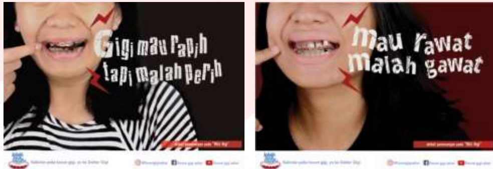
Gambar 3.10 poster

Penulis menggunakan dua poster yang digunakan sebagai poster awalan dan poster yang menggunakan headline.