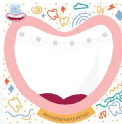
Gambar 3.9 twibbon

. Twibbon bertujuan untuk menarik simpati khalayak agar mengikuti kegiatan tersebut atau sebagai melambangkan sebagai tanda partisipasi target sasaran.