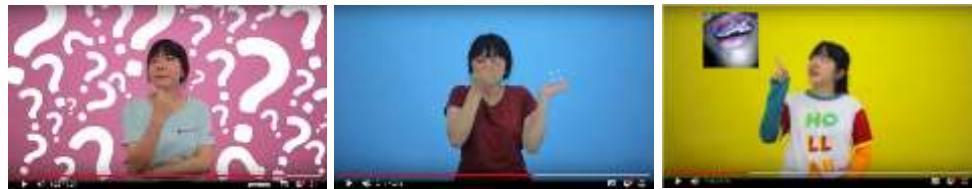
Gambar 3.8 video kampanye

Penulis menggunakan sebuah video yang digunakan sebagai media pendukung dari kampanye, selain itu untuk menarik perhatian target audiens