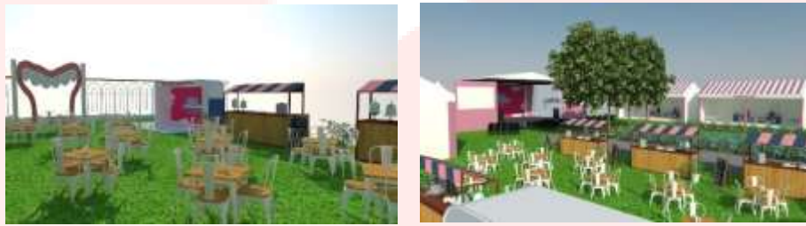
Gambar 3.7 event