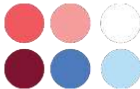
Gambar 3.3 warna