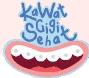
Gambar 3.5 hasil logo

logo dibuat menggunakan ilustrasi dan tipografi dengan warna yang girly agar khalayak dapat selalu mengingatnya.