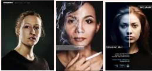
Gambar 3.1 referensi visual