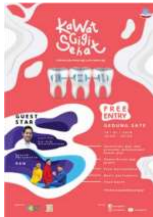
Gambar 3.6 poster event

Poster ini akan disebar melalui social media dan akan disebar melalui dinding-dinding yang remaja sering kunjungi. Dengan memanggil guest star membuat remaja tertarik untuk mengunjunginya.