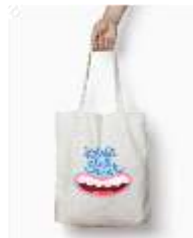
Gambar 3.12 merchandise