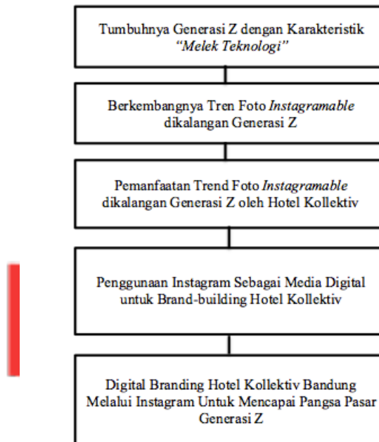
Gambar 2.2 Kerangka Pemikiran