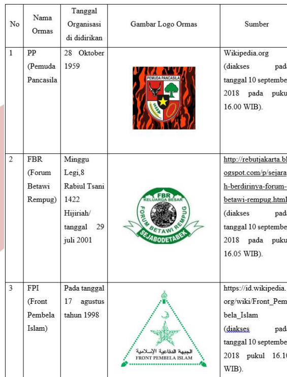
(Sumber: Hasil olahan Peneliti)

Peneliti telah merangkum beberapa Ormas yang mempunyai sedikit pendirian yang keras sehingga dapat menyebabkan ketidak sepehaman dengan ormas lain dan menyebabkan konflik yang berujung menjadi kericuhan antar ormas tersebut sehingga merugikan bagi ormas itu sendiri, lingkungan sekitar. Ormas yang penulis rangkum juga memiliki jaringan yang luas di wilayah Jakarta dalam bentuk tabel sebagai berikut: