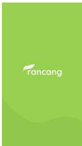
Gambar 1 Tampilan Awal Aplikasi