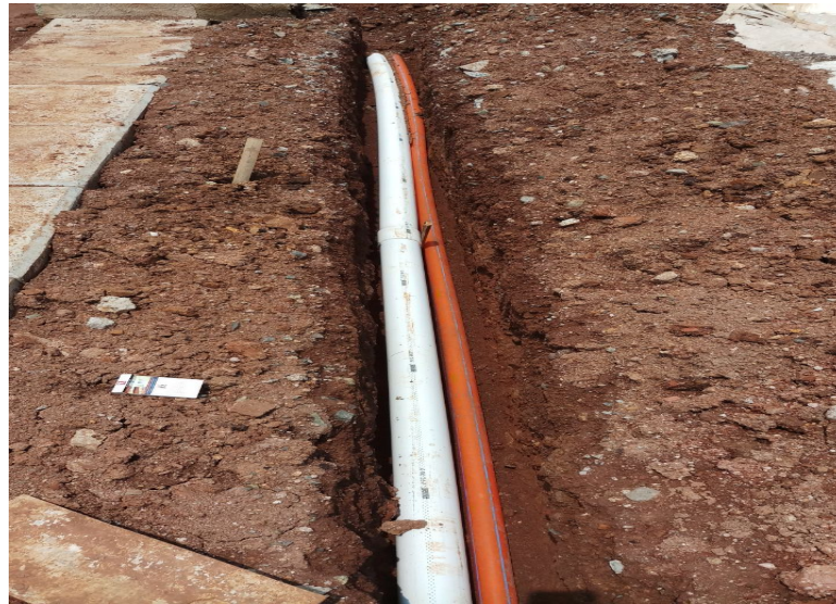
Gambar I.1 Ducting fo-sr

Dalam pengerjaan proyek untuk menghindari keterlambatan diperlukan tindakan kontrol untuk memantau suatu proyek dari fase awal sampai penutupan. Manajemen proyek dibutuhkan untuk merencanakan proyek dan mengendalikan waktu dan biaya proyek yang bisa dijadikan sebagai ukuran prestasi dari proyek. Dengan adanya manajemen proyek pihak kontraktor dapat mengetahui jika adanya penyimpangan yang signifikan agar dapat mengambil tindakan pencegahan. EVM ( Earned Value Management ) adalah salah satu metode untuk menganalisis kinerja suatu proyek. Apabila proyek yang sudah di kontrol menggunakan EVM ternyata terlambat maka perlu adanya crashing . TCTO ( Time Cost Trade Off ) adalah salah satu metode crashing yang bisa digunakan untuk mengatasi proyek yang terlambat atau behind Schedule .