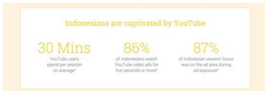
Gambar 1.2 Masyarakat Indonesia yang Terpikat oleh YouTube