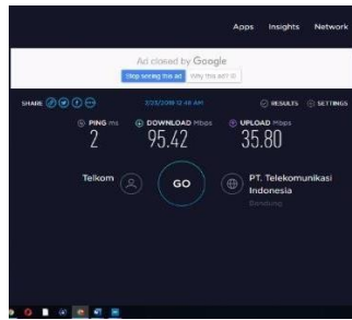
Gambar 3. Pengujian Jaringan Melalui Speedtest di kosan