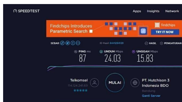
Gambar 4 Pengujian jaringan melalui Speedtest di LBN