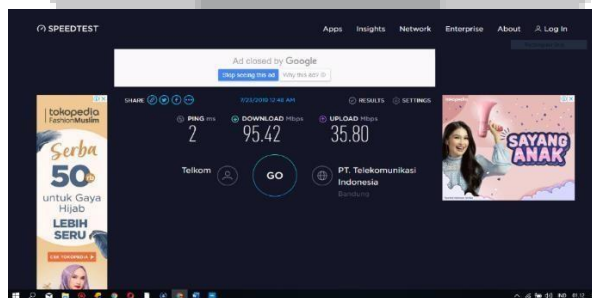
Gambar 5 Pengujian Jaringan Stabil melalui Speedtest