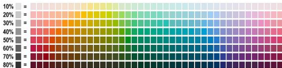
Gambar 1. 1 Color Model Calculator

Warna merupakan persepsi yang dirasakan oleh visual manusia terhadap panjang gelombang cahaya yang dipantulkan oleh objek. Warna dihasilkan ketika suatu energi cahaya mengenai suatu benda, dimana cahaya tersebut akan di refleksikan atau di transmisikan secara langsung oleh suatu benda yang terkena cahaya. Dengan ilmu alam, warna adalah gelombang atau secara ilmiah, warna adalah interpretasi otak terhadap campuran tiga warna primer atau warna dasar yang berada di dalam cahaya yaitu; merah, hijau, dan biru. Sebuah spektrum yang terdapat dalam suatu pencahayaan yang dapat dilihat oleh mata manusia secara visual adalah warna, setiap warna mempunyai panjang gelombang yang berbeda dan hal ini lah yang membuat warna dapat menjadi berbeda-beda di dalam pandangan visual manusia. Dalam ilmu kesenian, warna bisa di artikan sebagai pantulan tertentu dari cahaya yang dipengaruhi oleh pigmen yang terdapat di permukaan benda.