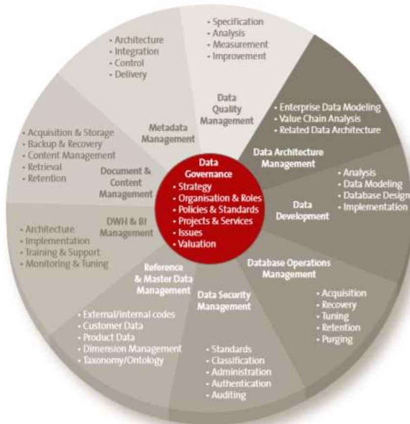
Gambar 1. Data Manajement (2017 DAMA-DMBOK 2 International)

Dalam sepuluh lingkup data pada gambar 2, berikut tahap tahapan yang ada di setiap data: