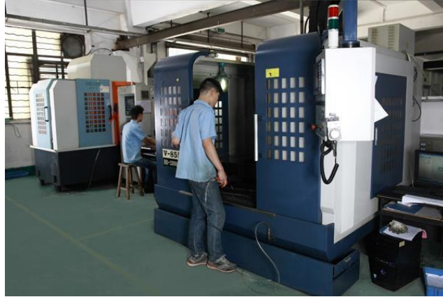
Gambar I. 2 Mesin CNC

Pada gambar diatas adalah bentuk dari PT.FLA tidak menggunakan alat pelindung pada saat bekerja terlihat pekerja hanya menggunkan sepatu untuk melindungi diri pada rantai produksi. Jika perusahaan tidak menerapkan alat pelindung diri kepada pekerja akan mengakibatkan kecelakaan kerja dan juga akan menakibatkan kerugian kepa perusahaan. Tidak hanya pada gambar diatas tetapi PT FLA memiliki bahaya – bahaya yang bisa terjadi dilantai produksi seperti, ketimpa bahan baku yang berat, terpeleset, tersandung, terjatuh, luka dibagian tubuh, hilangnya salah satu bagian tubuh dan yang paling bahaya adalah bisa terjadinya kematian. Ini membuktikan bahwa perusahaan harus menggunakan alat pelindung diri yang benar dan baik kepada setiap pekerja.